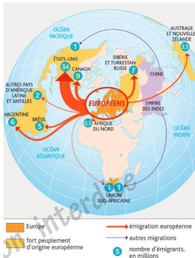
Document 2 : L'émigration dans le monde au XIXe s

Au XIX e siècle, grâce aux progrès agricoles, à l'hygiène et une meilleure alimentation, la mortalité baisse en Europe alors que la natalité reste forte. Il s'ensuit une forte hausse de la population.